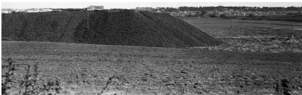
Vy norrut över delar av blivande Västberga industriområde. Över grushögens krön från vänster syns bostadshus i Midsommarkransen, Midsommarkransens gamla skola och därefter Nybodahemmets byggnader. På fältet till höger Årsta Koloniträdgårdar framför Årsta skog med Högalidskyrkans torn som sticker upp över träden. 1939

Under andra världskriget fanns det ett stort behov av mängder av kol och eftersom det fanns outnyttjad mark och en bra industri järnväg i Västberga Industriområde så anlades 1939 ett stort kol-lager på andra sidan av Västberga Alle (Där nu DHL numera har sin transport depå)