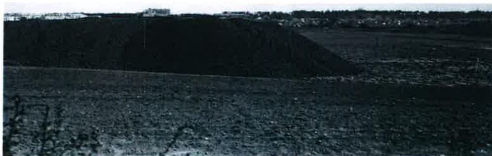
Vy norrut över delar av blivande Västberga industriområde. Över grushögens krön från vänster syns bostadshus i Midsommarkransen, Midsommarkransens gamla skola och därefter Nybodahemmets byggnader. På fältet till höger Årsta Koloniträdgårdar framför Årsta skog med Högalidskyrkans torn som sticker upp över träden. 1939

Under andra världskriget fanns det ett stort behov av mängder av kol och eftersom det fanns outnyttjad mark och en bra industri järnväg i Västberga Industriområde så anlades 1939 ett stort kol-lager på andra sidan av Västberga Alle (Där nu DHL numera har sin transport depå)