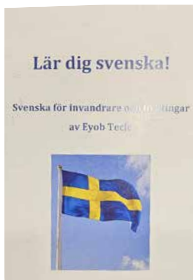
Lär dig svenska av Eyob Tecele

Många av hans elever behöver inte bara lära sig det svenska språket i praktiken - utan även hur man kan umgås med och bättre förstå de svenskfödda för att smidigt kunna leva i det svenska samhället, förstå hur det är att vara svensk och vad den svenska kulturen står för.