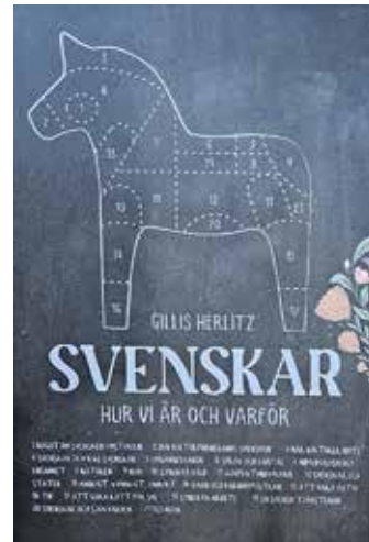
Svenskar hur vi är och varför

- Svenskar är lite reserverade när det gäller att vara hjälpsamma på individnivå. Man är hellre organiserat hjälpsam i en kollektiv grupp. Exempelvis i kyrkan, föreningen eller idrottsklubben.