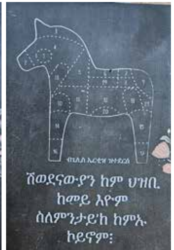
Svenskar hur vi är och varför