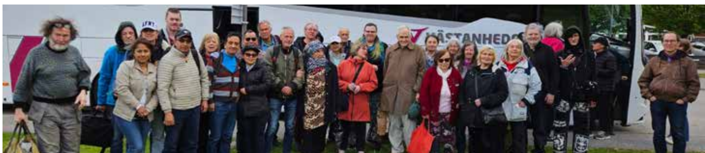
Hela gänget på utflykten!

(För er som är intresserade av tåghistorik finns mer beskrivet i Ny Gemenskaps historieskrift "Västberga Nu och Då" Där finns info om den järnväg som gick bakom norra Annexet och annan järnvägshistoria.)