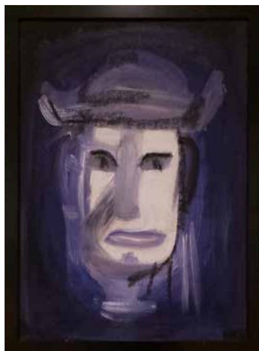
Målning av Lotta Olsson